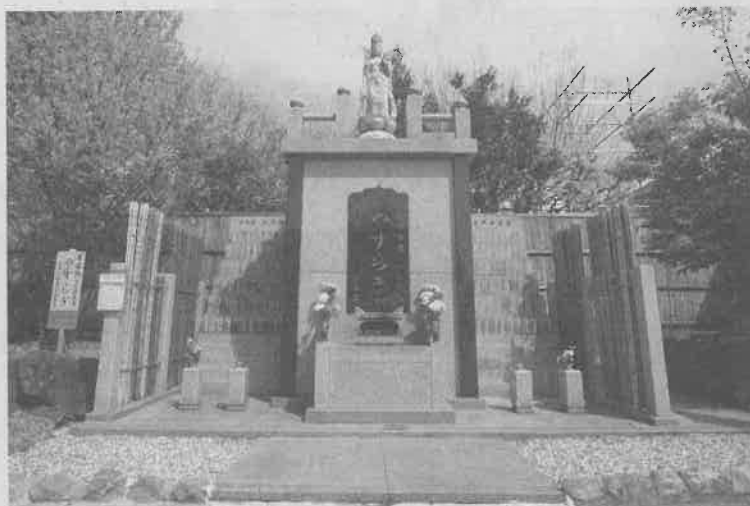
立川市・常楽院の永代供養墓付個別墓。供養塔の脇に仕切りで区切った空間があり、個別に遺骨を納める

「供養塔の地下に設けた石造りの棚に骨壺を安置し、一定期間後に遺骨を土におかえしするのが、私たちがご提供している『永代供