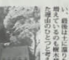
お墓の価格が上がる一方、お墓の維持管理が難しいという課題が生まれていませんか？