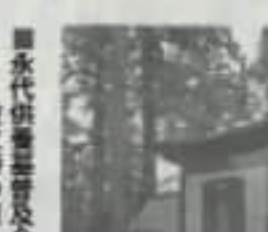
お墓の価格が上がる一方、お墓の維持管理が難しいという課題が生まれていませんか？